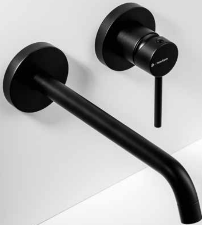
01.093 NERO OPACO MATT BLACK